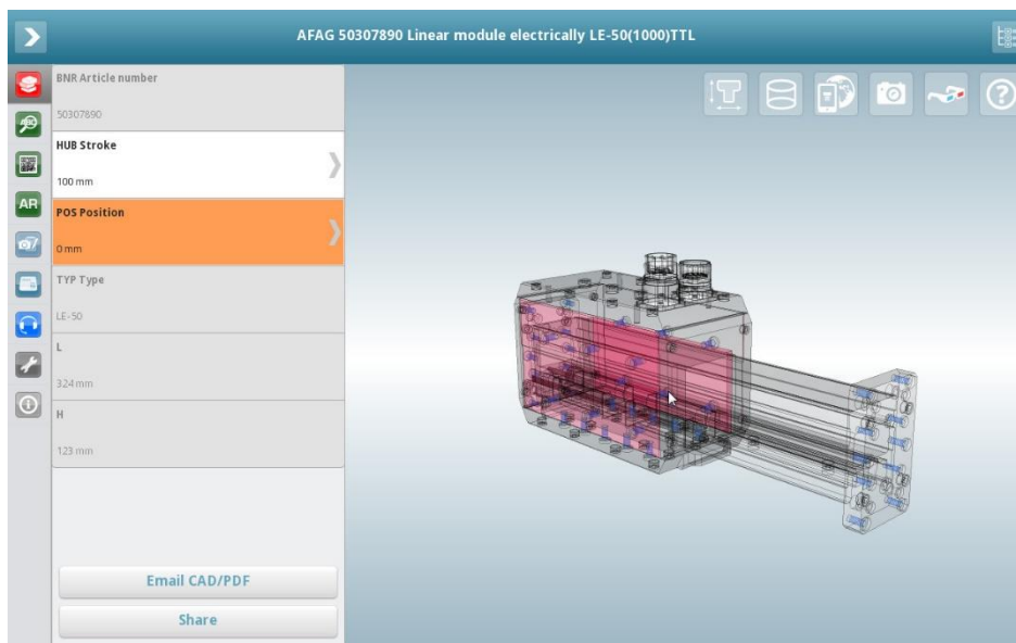
Bildunterschrift 2: PARTcommunity 3D CAD Modelle App mit Transparenzansicht